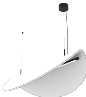
RIPPLE 12x40 cm