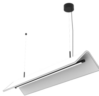
ARCUS 120x40 cm