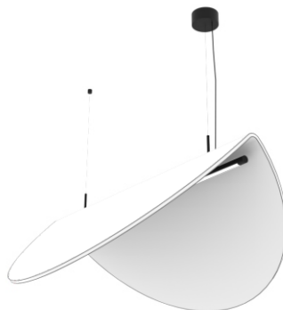
SWAY 100x50 cm